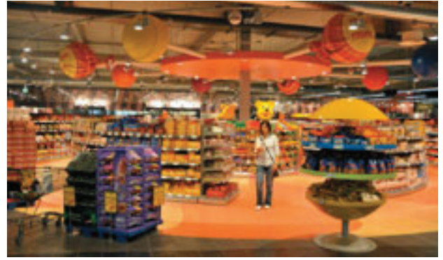
Bereits vor dem Eingang präsentiert sich das große SB Warenhaus mit dem nicht zu übersehenden LEMGO-Logo. Außergewöhnlich ist auch die rund gestaltete Süßwarenabteilung mit ihrer großen Auswahl auf 250 Quadratmetern.